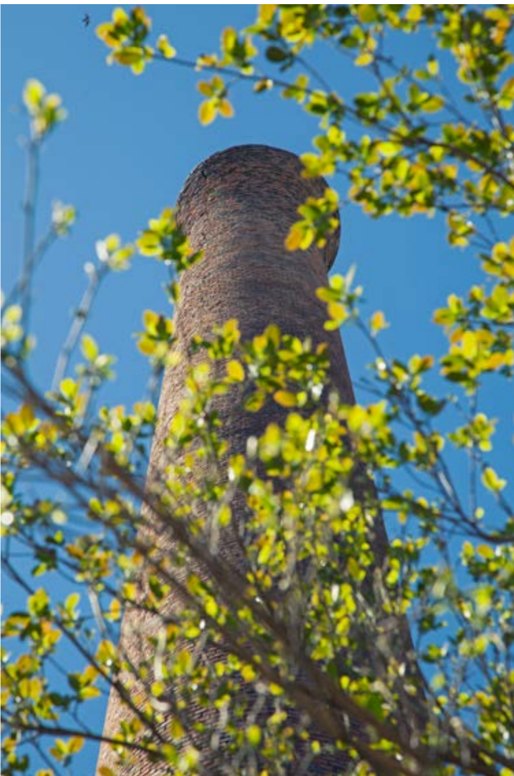
Rogério Amaral Ribeiro (RAR)