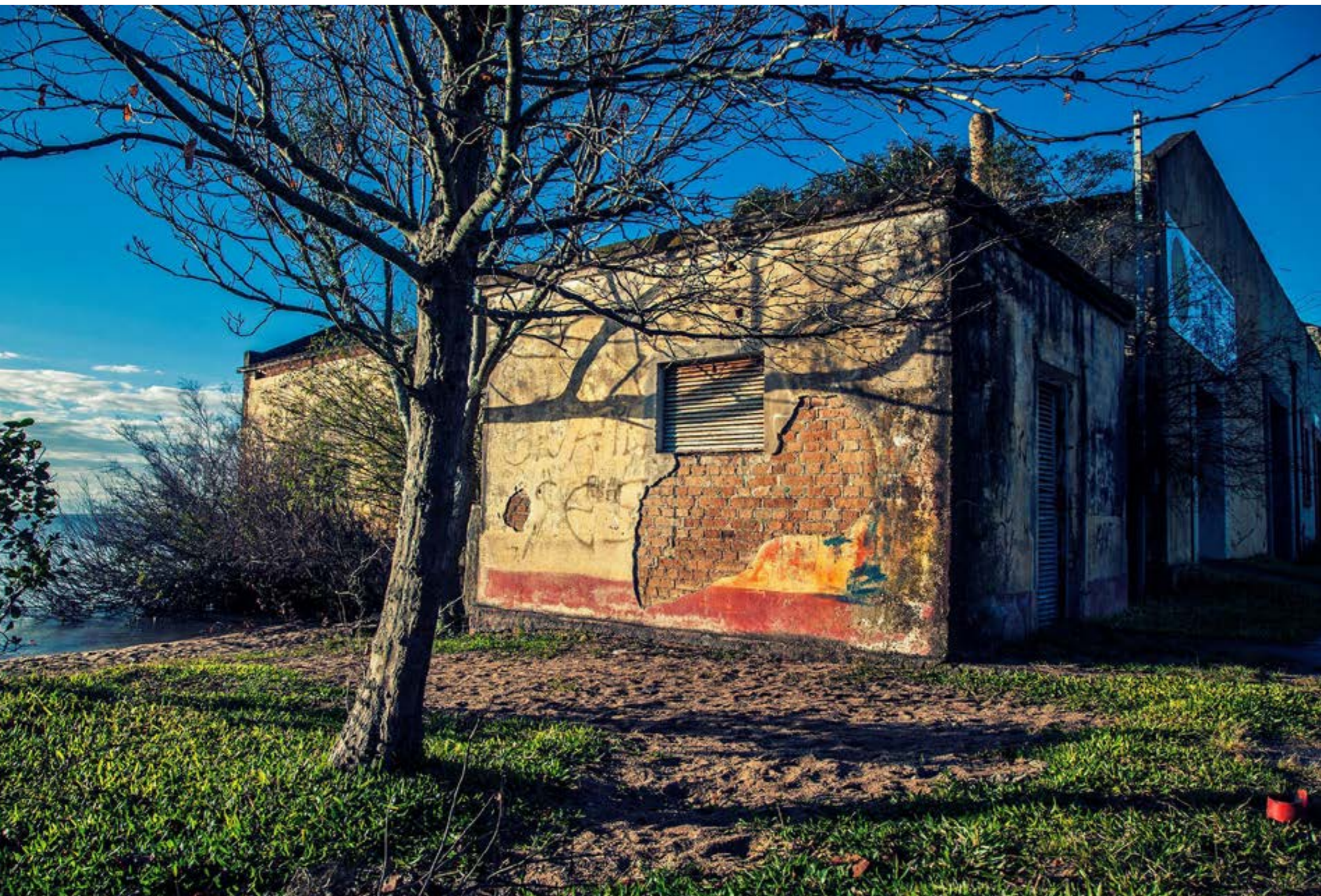
Rogério Amaral Ribeiro (RAR)